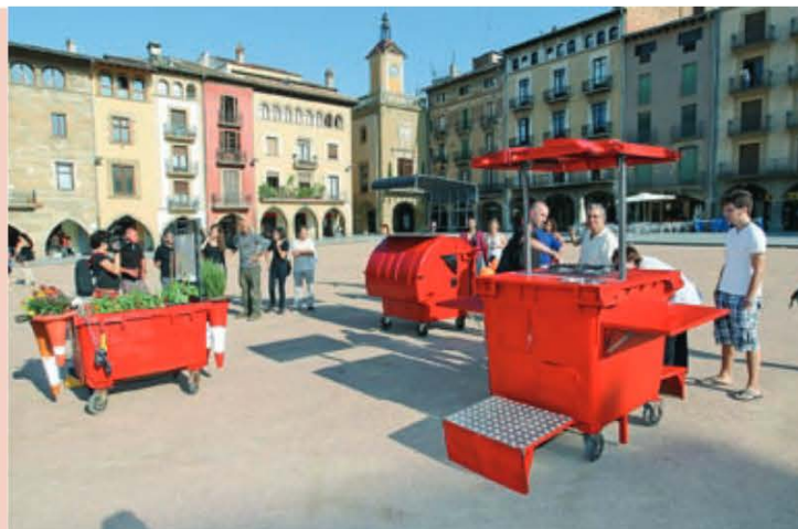
JORDI CABANES / JORDI PUIG