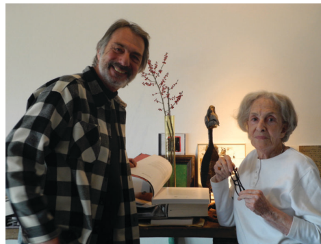
Ida Vitale... i tal i tant. Frederic Amat amb la poeta uruguaiana Ida Vitale, el 2013.

Pel principi, del punt la línia i el mot en el gest, i la frase com a espai d'espais en el pla. Tot és ritme i accent, pausa i aparició sobtada. La història de l'escriptura neix entre la taca i el silenci. El lloc en el que es performa l'acció és el temps de l'escriptura i el lloc on es perpetua el seu dinamisme és en l'espai del llibre, la seva cova i arquitectura.