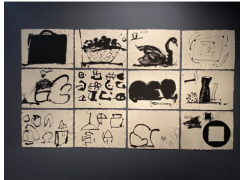
Serigrafies de Frederic Amat del llibre fet amb textos de Juan Benet “Visitas de 1 a 12”.

recullen i memorialitzen experiències para-artístiques, protoliteràries, cinematogràfiques, teatrals i que fan una exploració gràfica equivalent a la seva recerca plàstica. Al darrer mur, dels “Llibres il·lustrats” que han provocat centenars de dibuixos evocatius d’antigues escriptures i civilitzacions, hi copsem un magnànim i extraordinari mosaic derivat de l’obra “Les mil i una nits”; i tanca l’exposició uns originals resultants de L’Odissea , d’Homer. Amat avança al món modern de l’edició com la literatura fa, de recules, fins als nostres clàssics.