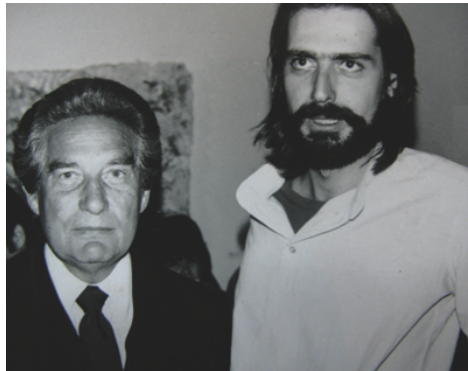
L'artista Frederic Amat amb el poeta i assagista Octavio Paz, 1978.

El primer testimoni d'aquesta relació el trobem en el dibuix per a la coberta de la plaquette "Tots hi serem al Port amb la Desconeguda", un cap d'any del 1973, amb el qual J.V. Foix, investigador en poesia i amic de les arts, saludava els amics als seus vuitanta anys. Així el poeta de la primera avantguarda oferí, com havia fet amb Miró i Dalí, i més tard amb Tàpies i Ponç, l'espai renovador d'una cultura filològica i d'estètica avançada a un jove artista de vint anys. Després fou ell, l'Amat, qui convidà Joan Brossa, de la segona avantguarda, explorador de la poesia visual, la poesia escènica i les arts parateatrals, en el seu primer llibre, una capsa de màgia excepcional, "Llibre de la pluja": les serigrafies fan de teló per a les accions. De llavors ençà, els encontres i agermanaments singulars amb textos d'altres han pres forma de llibre en edicions que tracen la biografia intel·lectual de l'artista. De fet es tracta de traspassaments de llibres de la seva tria significant a un autor que destil·la el que li és donat fins a crear, de bell nou, una escriptura visual que és també poesia i germinació.