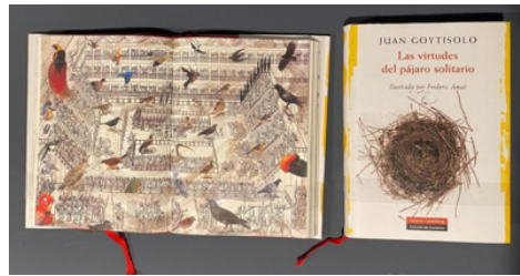
Doble pàgina interior i coberta del llibre de Juan Goytisolo, Las virtudes del pájaro solitario , il·lustrada per Frederic Amat, 2007.

llibres de Frederic Amat han vist potenciar els aspectes innovadors i tradicionals, artesanals i industrials, que el disseny gràfic aporta a través d'ambdós creadors al món del llibre i del llibre d'art.