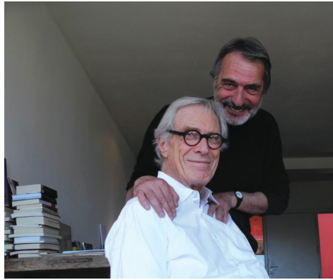
El poeta Mark Strand i Frederic Amat, el 2012, que juntament amb Bob Wilson es troben al llibre "Seven Days".

Carregat de totes les escriptures (de civilitzacions i llengües, de memòria i de ruptures), l'art esdevé poesia de per si. Aquesta és l'aportació superior que Frederic Amat fa, com s'evidencia en aquesta exposició: traspasar la lectura de l'escriptura dels altres a acció refundadora de l'escriptura del visual.