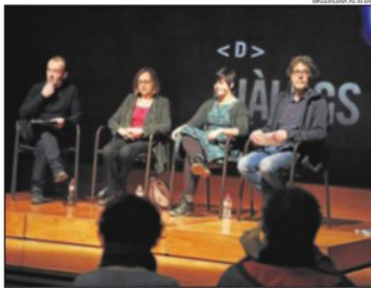
Un moment del debat 'Cultura i infància' de l'Espai Orfeo.

«Estem en un terreny de difusió tan canviant que a les petites produccions ens costa