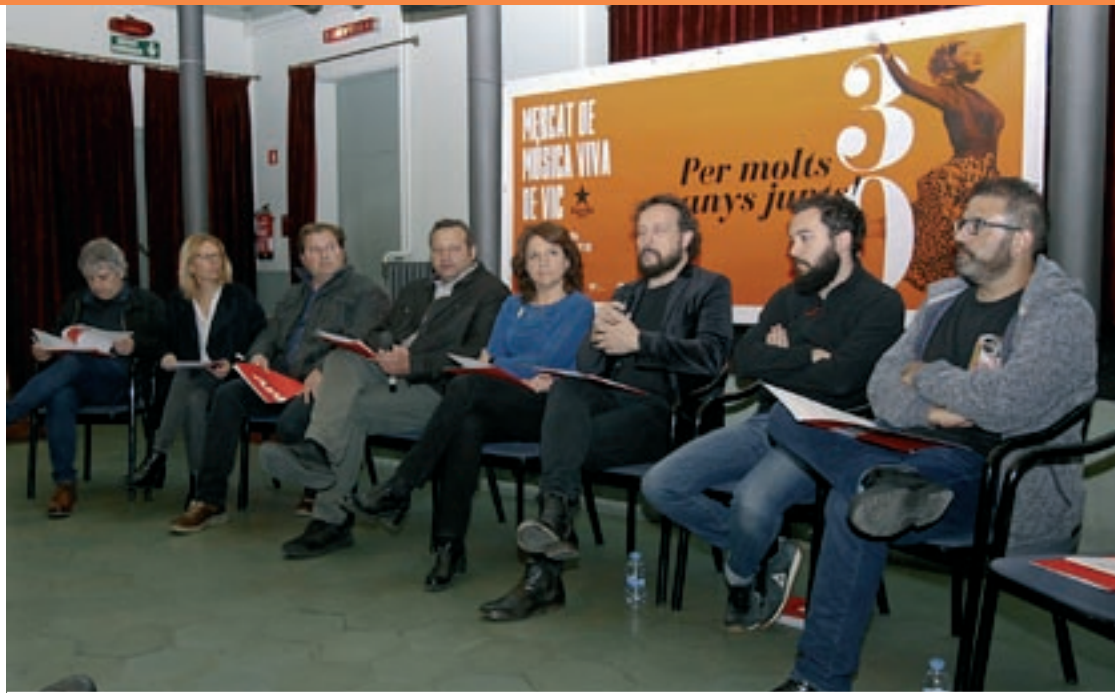
La presentació dels actes del 30è aniversari del MMVV, aquest dimarts al Casino, que acull una de les actuacions

Les primeres actuacions en aquesta línia han estat les de Nyandú al Mercat del Ram, dins de l'Espai Terra i Cuina, i de The Zephyr Bones a la Festa Major de la Universi-