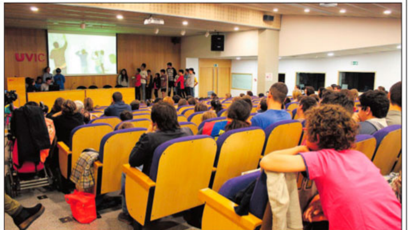
La presentació del projecte per part de les dues escoles del Ripollès que hi han participat.

Durant les presentacions, els alumnes van tenir uns 10 minuts per explicar a altres escolars «l'experiència viscuda durant la realització de cada projecte», com va comentar des d'ACVic Centre d'Arts Contemporànies. També es va fer una trobada al professorat.