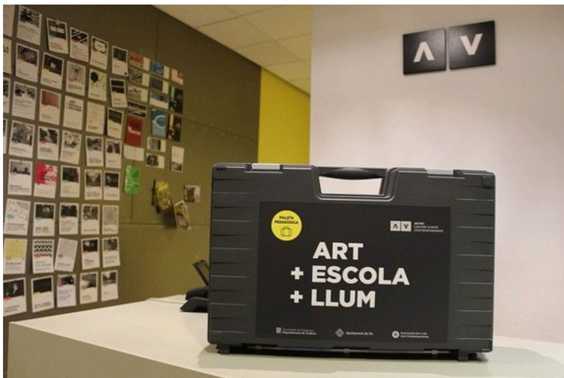
La Maleta Pedagògica

La novedosa iniciativa està impulsada per ACVic Centre d'Arts Contemporànies