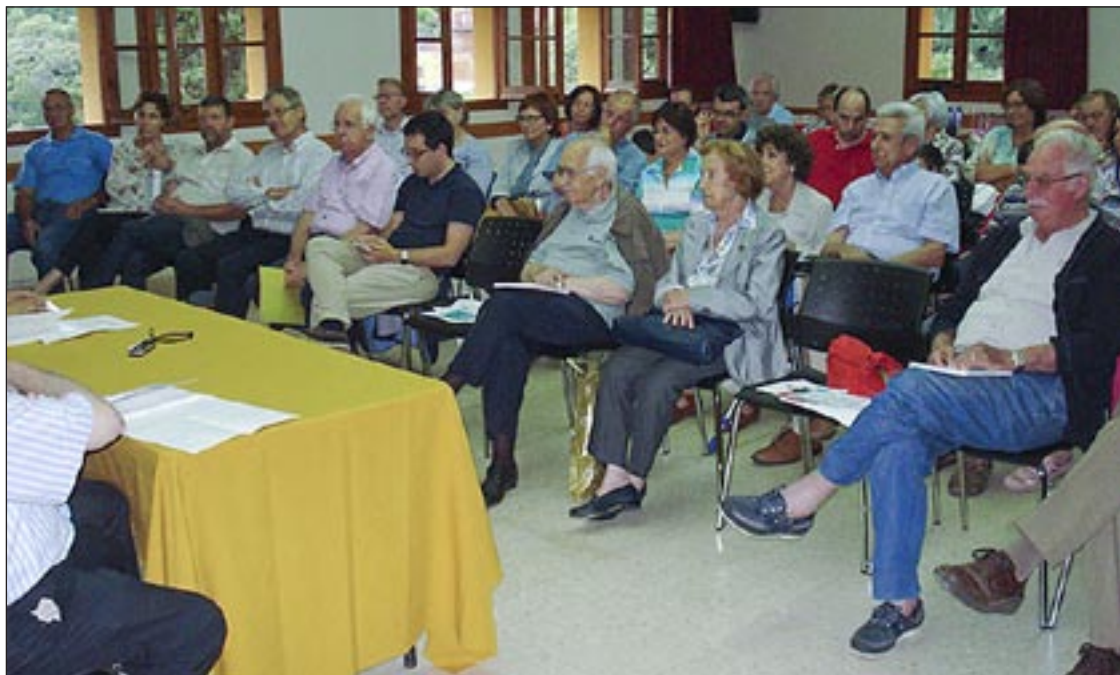
La presentació del número 29 de les 'Monografies del Montseny', al poble de Montseny