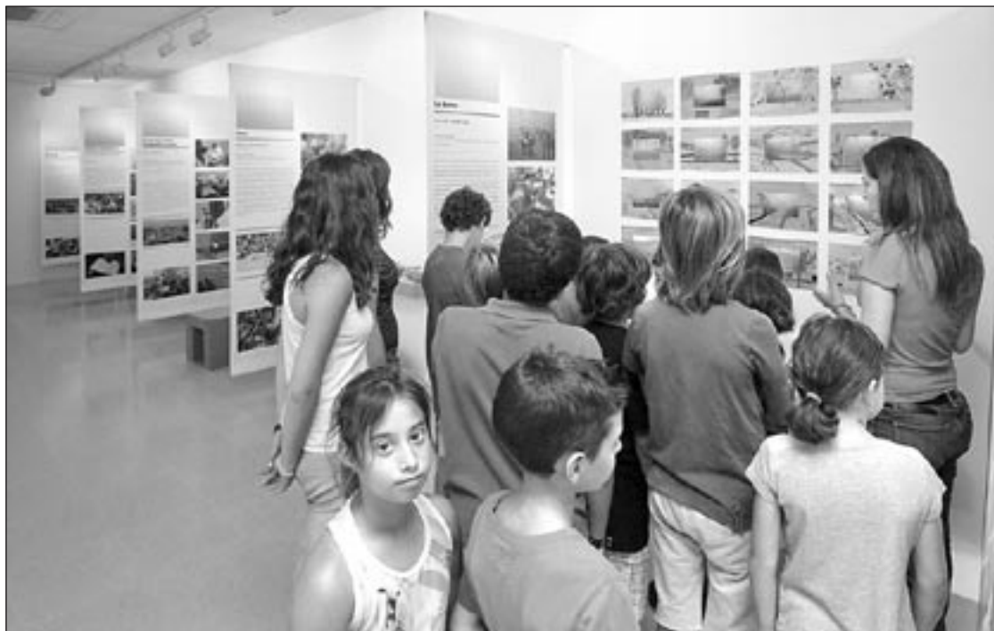
Alumnes d'un casal d'estiu visitant l'exposició, aquest dijous al matí. La mostra està oberta fins a finals de setembre

Vic Aquí Spot, juntament amb Aurosa Projectes, ha organitzat aquest setmana tot un seguit de tallers artístics a partir de material en desús que culminaran, dissabte, amb el 1r Festival Art-Roulotte, que tindrà lloc entre el passeig de la Generalitat i el carrer Bisbe Strauch, a Vic. Les activitats formen part del Programa de Joventut Europeu i compta amb la participació de joves eslovens, italians, portuguesos i catalans. Hi col·laboren entitats com La Fàbrica dels Somnis, l'ACVic, l'Escola d'Art i la Jazz Cava. El festival arrencarà a les 4 de la tarda amb tallers i actuacions, i acabarà a les 12 de la nit amb una Jazz Cava Electrònica.