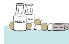
16 Adams, Carol J. (2020) The Pornography of Meat , Bloomsbury.