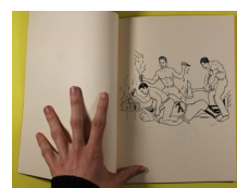
14 Al Capp, The Short Life and Happy Times of the Shmoos .

12 Katz és una còpia exacta de la versió francesa de Maus , on tots els personatges són gats. Va ser publicat l'any 2011 i es va fer públic en el context del festival de còmic d'Angòleme l'any 2012 que aleshores presidia Spiegelman. Flammarion, l'editorial de la versió francesa, va denunciar i finalment va fer destruir les còpies de Katz. Manouach, Ilan (2011) Katz, Bèlgica: La Cinquème couche. https://ilanmanouach.com/work/katz/ 13 Black Panther Coloring Book, S_U_N Books & Editions, New York/LA, NY/CA, 2015. En línia: https://www.printedmatter.org/catalog/41763/