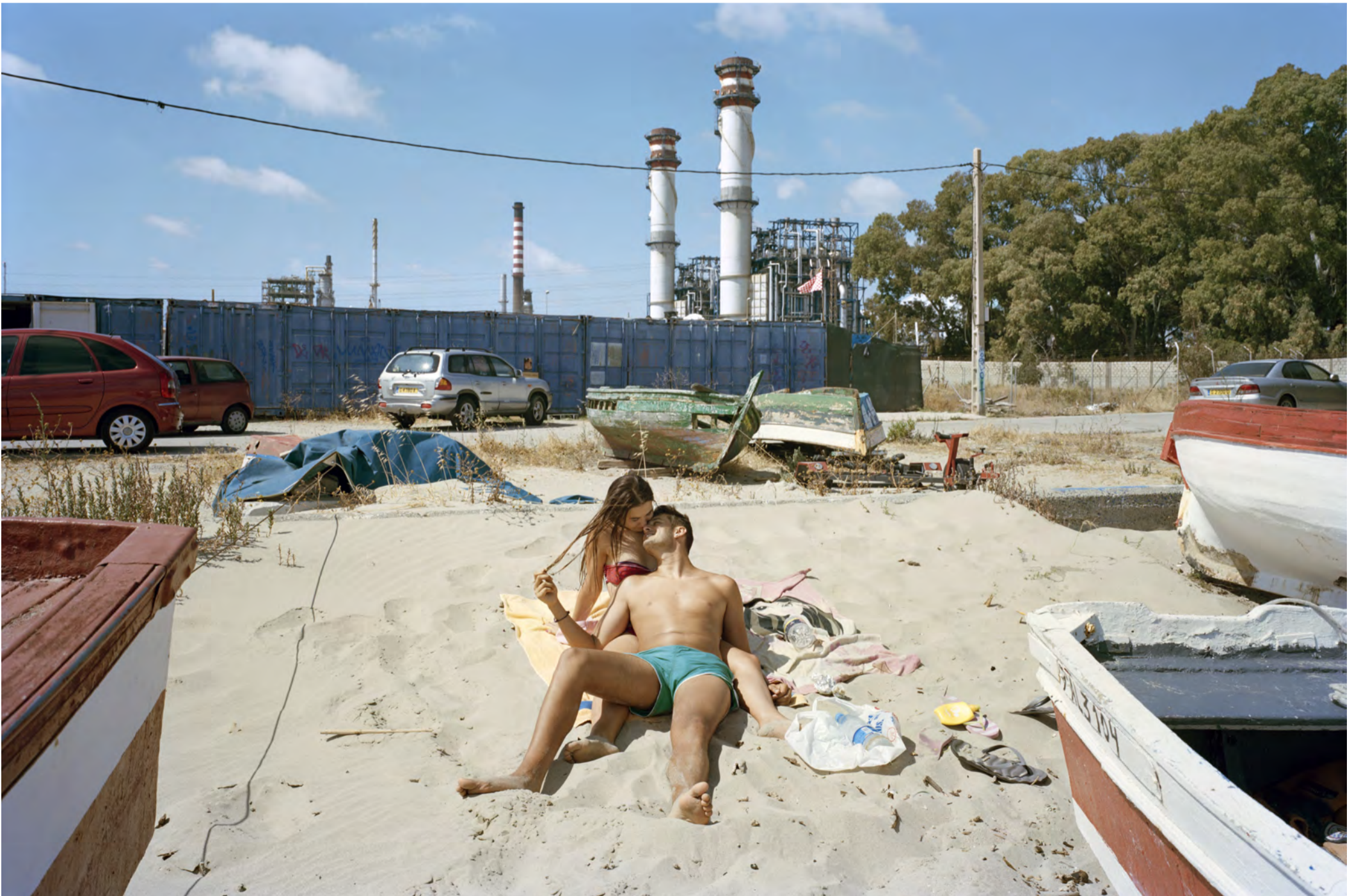
San Roque, de la sèrie Perfect Day, 2005-2020.