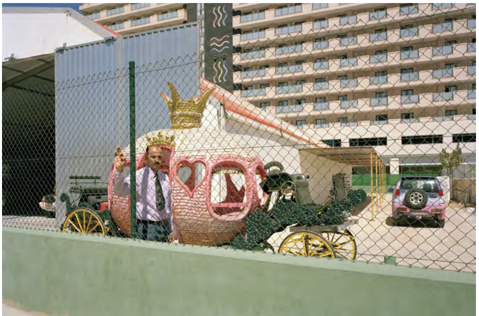
Oropesa del Mar (Marina d'Or), de la sèrie Perfect Day, 2005-2020.