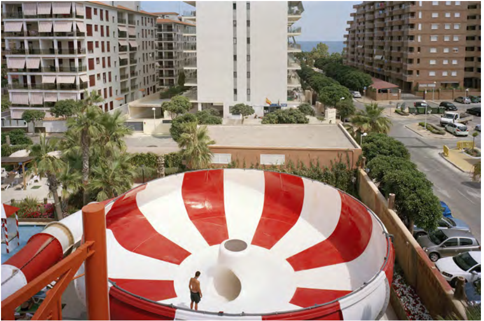
Oropesa del Mar (Marina d'Or), de la sèrie Perfect Day, 2005-2020.