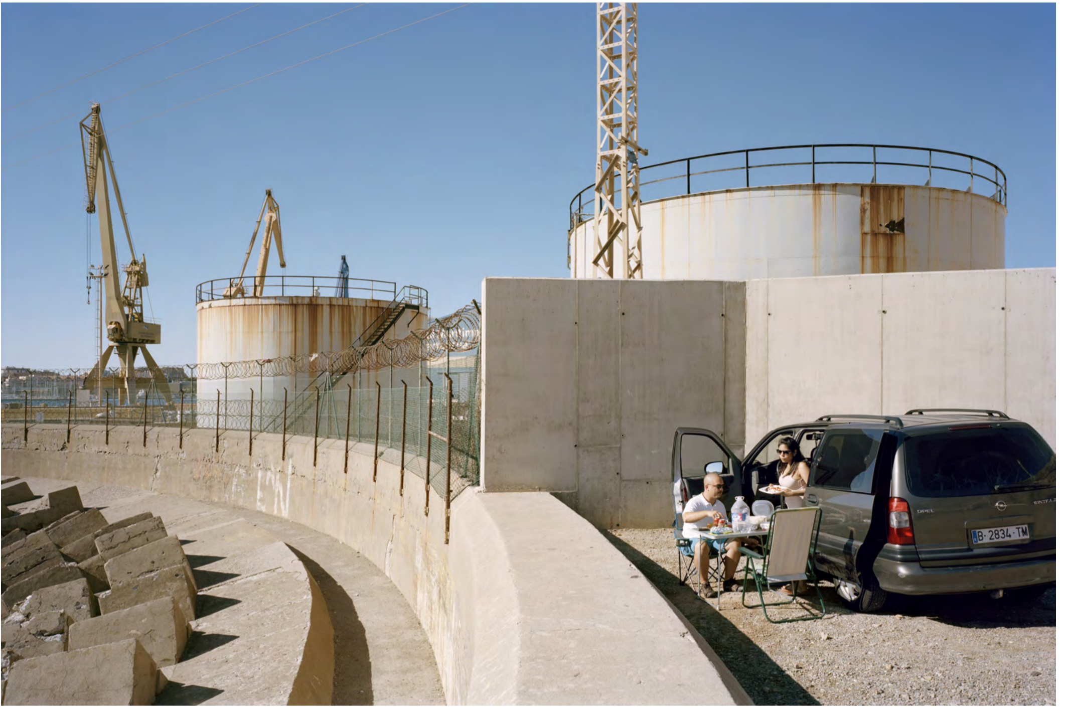
Cartagena, de la sèrie Perfect Day, 2005-2020.