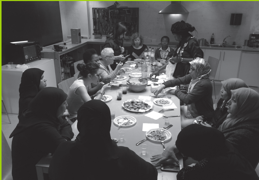
Identitats-visibilitat. Taller PAIC / Vic 2017.