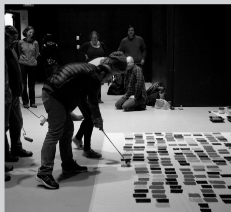
Project DIY, Maine USA