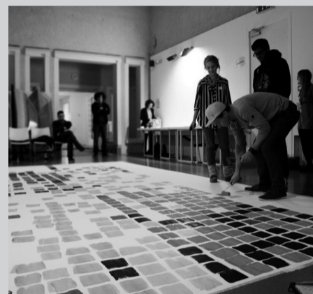
Project DIY, Tate Gallery St. Ives