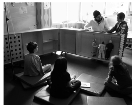
Mon Unité Mobile, Perpinyà 2008