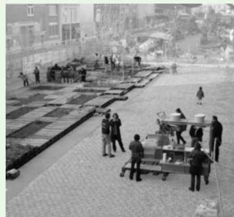
Construcción del jardín y cocina móvil. 2004.