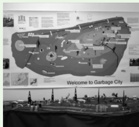
Carteles y maqueta producida en el proyecto Garbage Problems. New York City, 2002