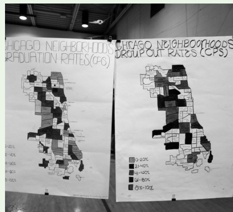
Exposición de Notes For a People's Atlas of Chicago en el gimnasio del centro Wicker Park de Chicago, Enero 2009.

En 2001, el grupo Atelier d'Architecture Autogérée (aaa) emprendió una serie de proyectos autogestionados en el área de La Chapelle, al norte de París, en los que se promovió el acceso de los residentes de la zona a espacios infrautilizados para llevar a cabo una transformación crítica de los mismos. La serie comenzó con el establecimiento colectivo de un jardín temporal, denominado ECObox, construido a partir de materiales reciclados en un hangar que pertenecía a la RFF (compañía ferroviaria francesa), con el que se encontraron tras analizar los espacios abandonados que existían. El jardín fue progresivamente convirtiéndose en un laboratorio de producción cultural