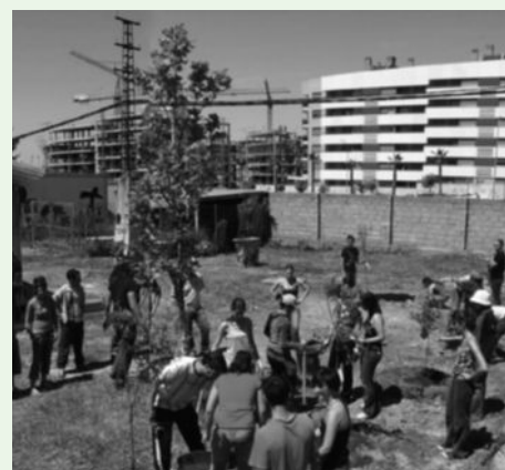
Imagen del primer taller de plantación en Aulagarden. Granada, abril 2008.

donde se suceden actividades, discusiones, talleres y todo tipo de producciones materiales e inmateriales.